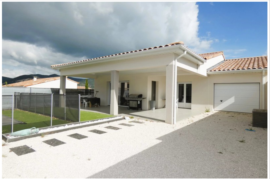
House 4250 Montélimar