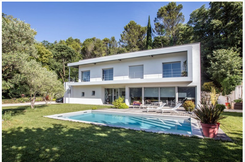
Villa 4253 Montélimar