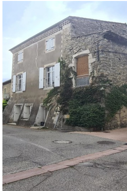
Village house 4316 Puy-Saint-Martin

Fees and charges : 200 000 € fees included